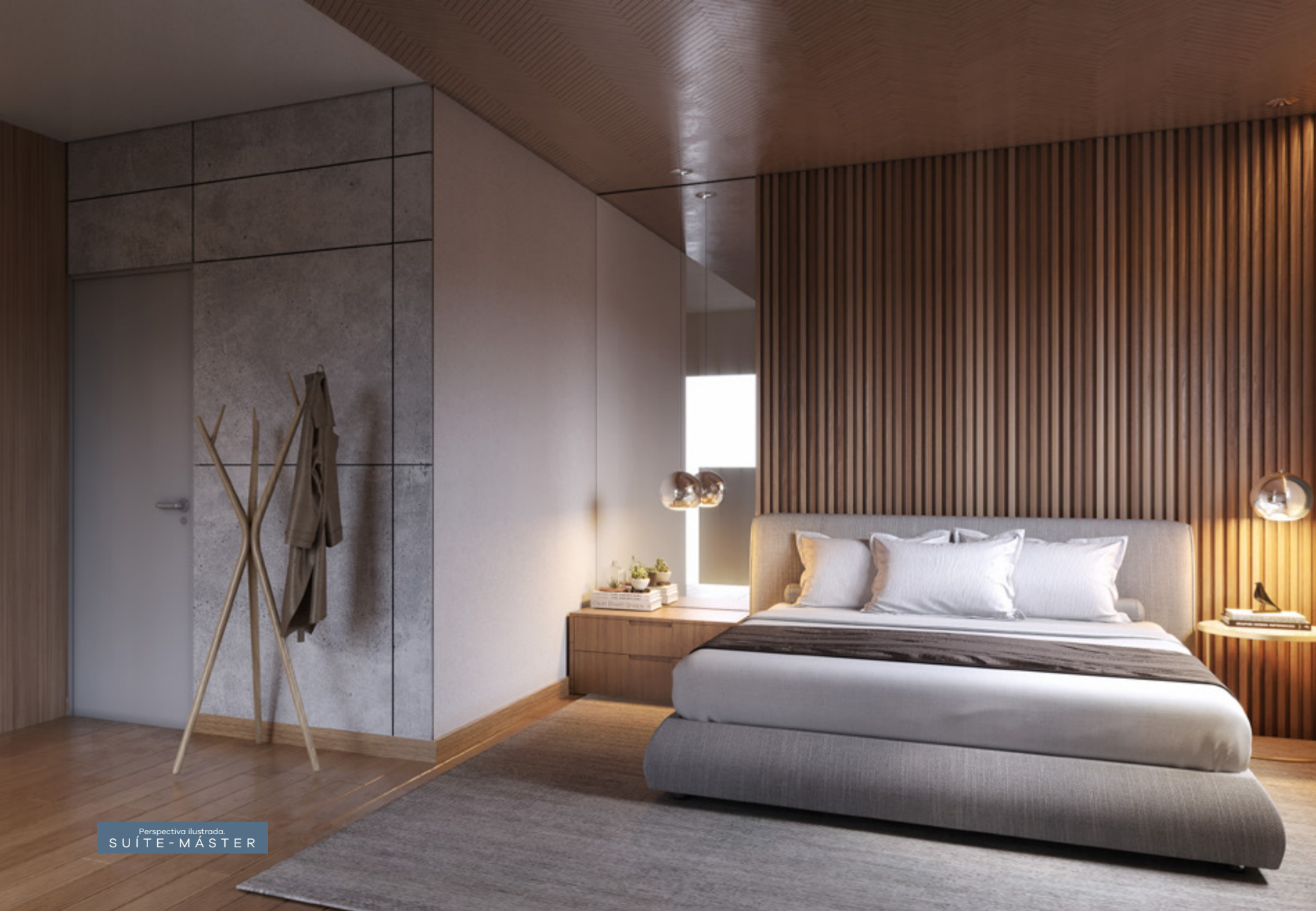
Perspectiva ilustrada SUÍTE MASTER