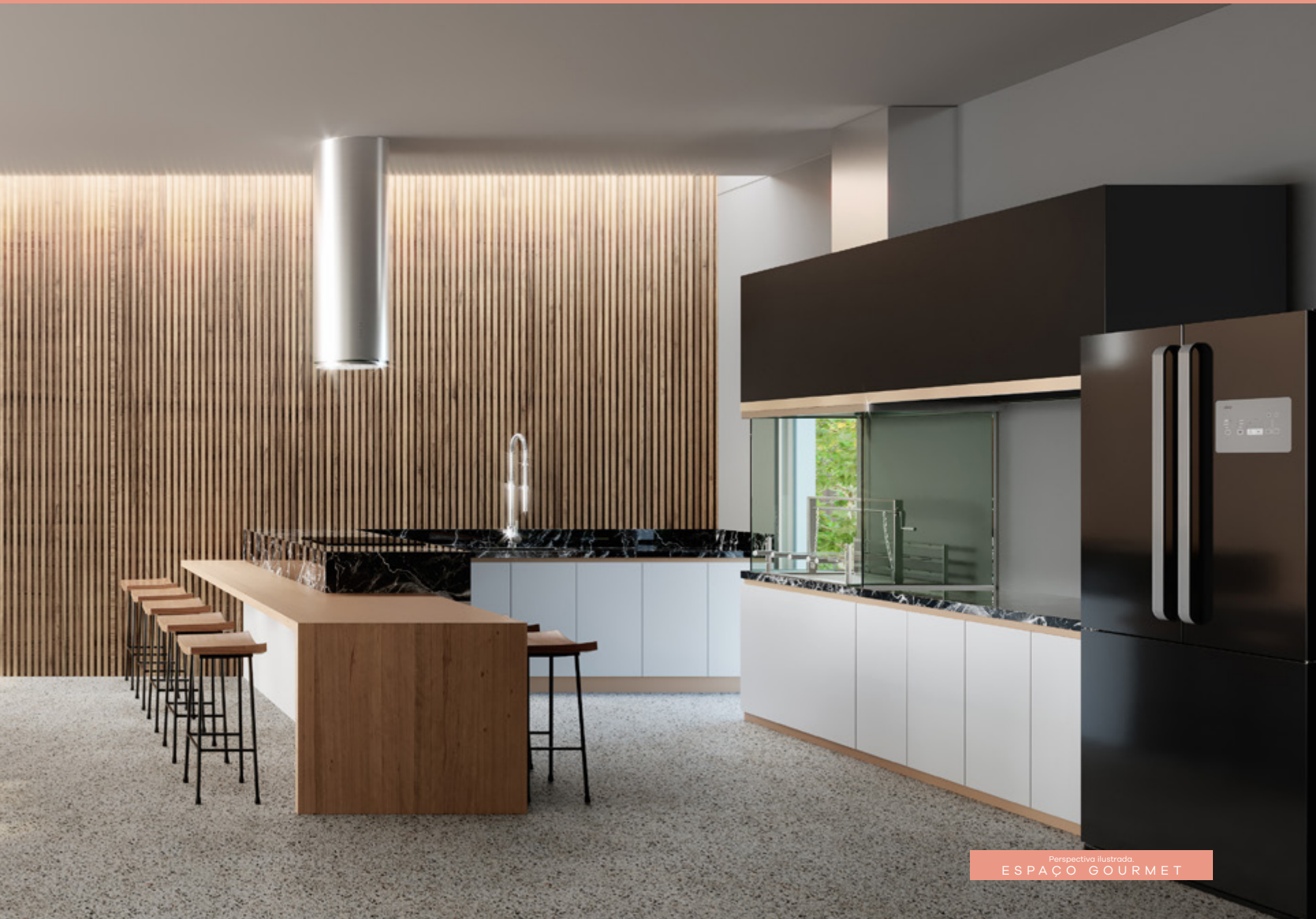
Perspectiva ilustrada. ESPAÇO GOURMET