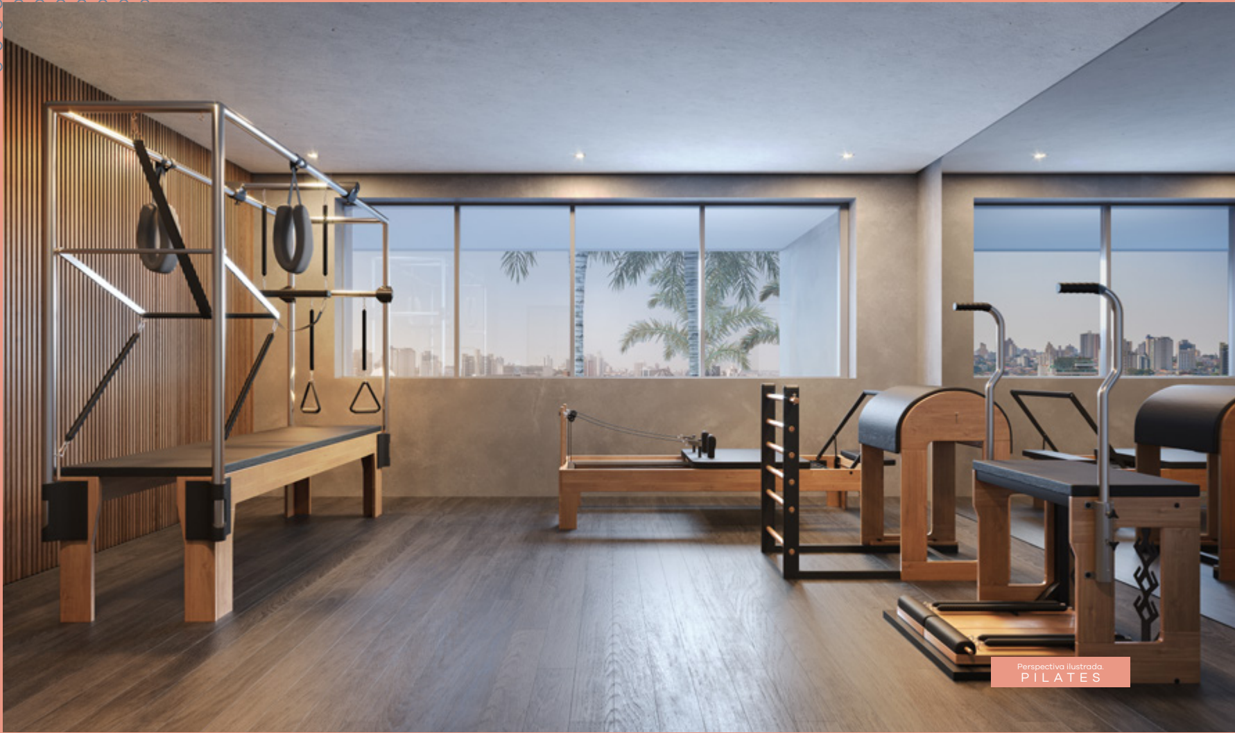
Perspectiva ilustrada. PILATES