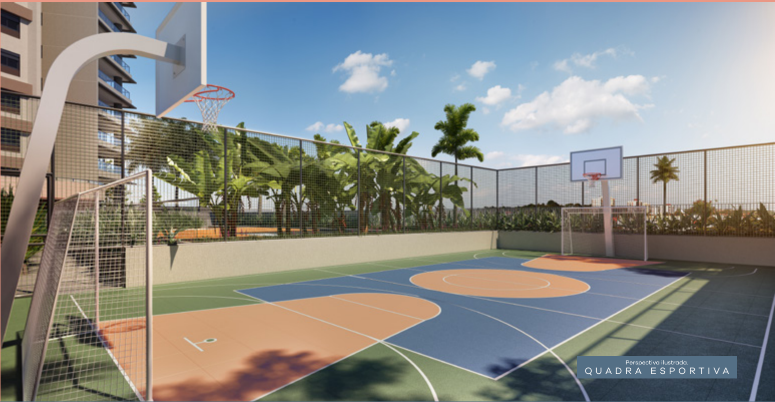
Perspectiva Ilustrada. QUADRA ESPORTIVA

Imagens meramente ilustrativas, sujeitas a alteração sem aviso prévio. Equipamentos e acabamentos conforme memorial descritivo, anexo ao compromisso de compra e venda.