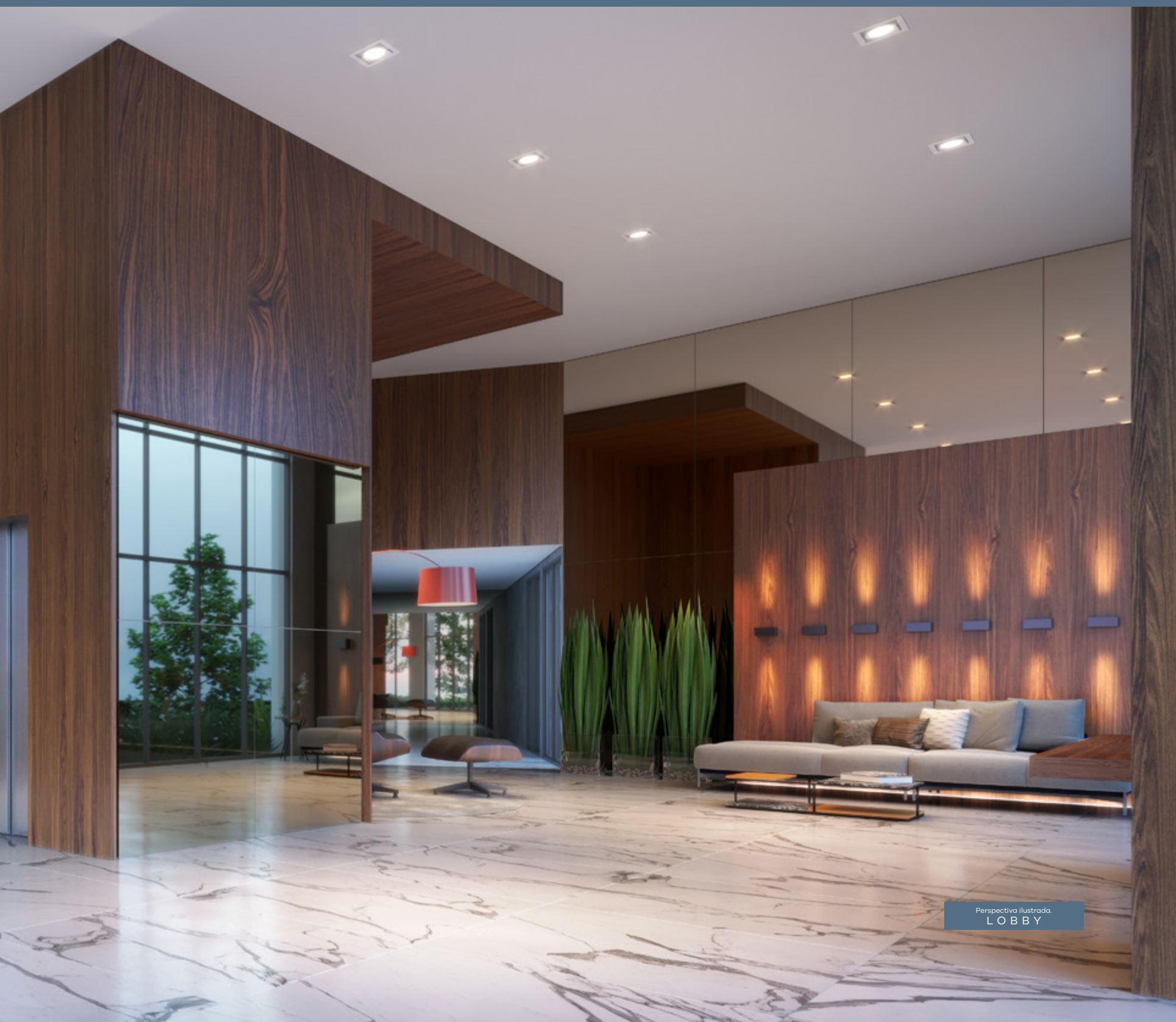
Perspectiva ilustrada. LOBBY