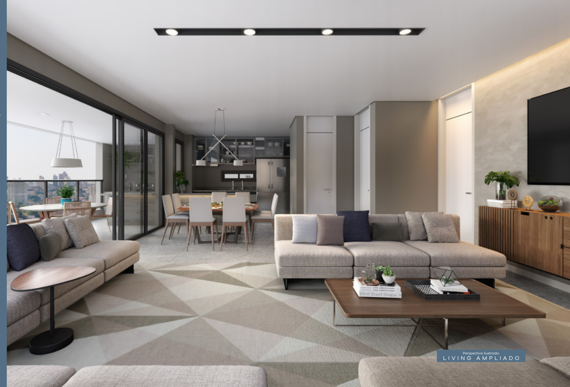
Perspectiva ilustrada. LIVING AMPLIADO

Planta com hall social privativo. Lavabo de serviço e cozinha integrada ao terraço gourmet.